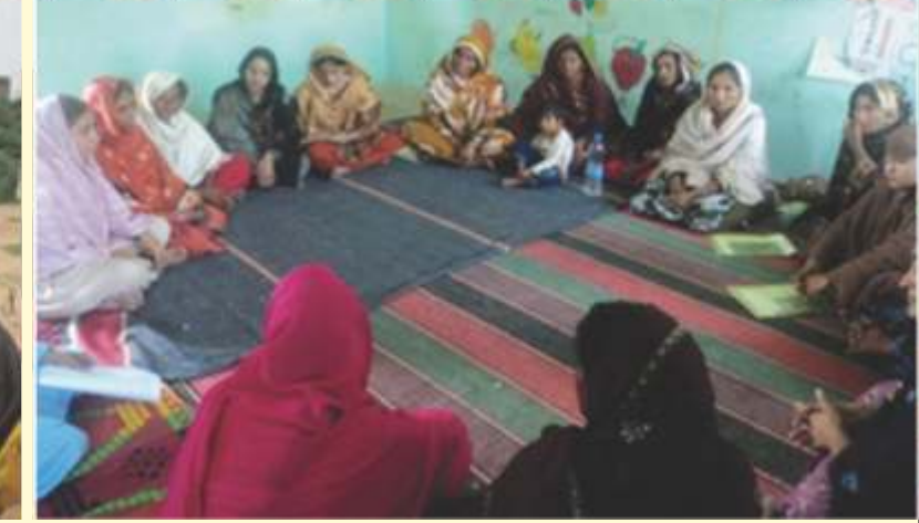
کیو، اساتہ اور والدین کے درمیان مکالمہ