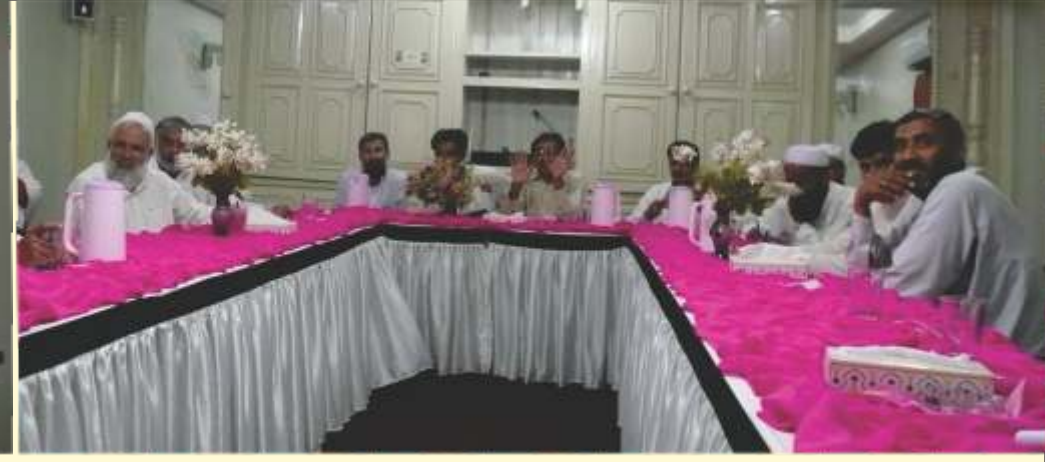
سوات میں پرائمری اسکول کے مسائل اور ان کے حل پر ای۔مکالمہ