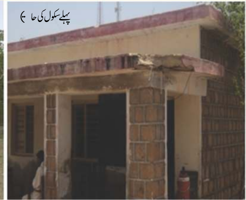
پہلے سکول کی حالت

اسکول کی اس عمارت کو قابل استعمال بنایا گیا جو اس سے پہلے ای۔کھنڈلنا دکھائی دیتی تھی۔